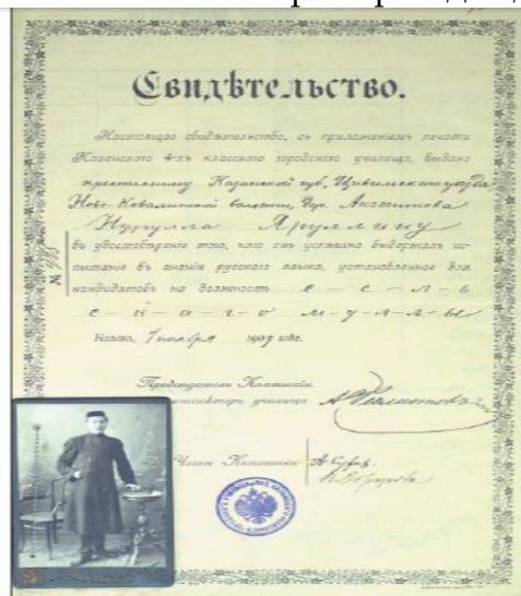
Свидетельство крестьянину дер. Акзигитово Нурулле Яруллы о сдаче экзамена по русскому языку, установленного для кандидатов на должность сельского муллы, выданное Казанским 4-классным городским училищем 7 ноября 1909 г. ГА РТ. Ф. 2. Оп. 2. Д. 8457. Л. 13

программа даёт новые возможности и качественные знания, в медресе ежегодно проводились экзамены. На экзамен приглашали мулл – преподавателей из соседних сёл, губерний и особо уважаемых лиц. Такие методы работы продвигали обучение на высокий уровень и являлись примером для других (рис. 5).