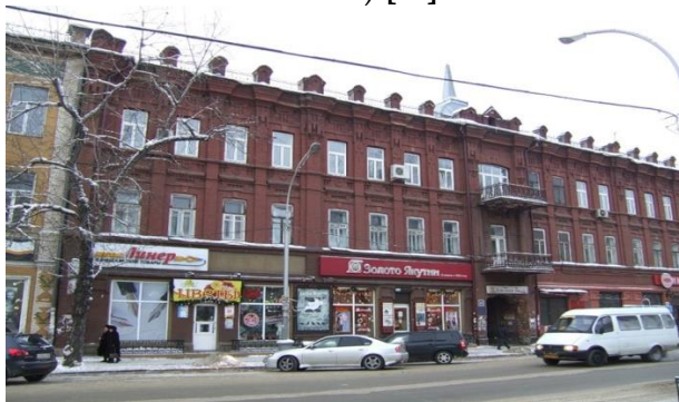
Рис. 4. Здание Торгового дома Шафигуллиных на улице Большой (ныне ул. К.Маркса) в Иркутске. Современный вид

Шафигуллины начали строительство трёхэтажного дома по ул. Большой. На первом этаже помещалась мастерская и магазин «Торговый дом братьев Шафигуллиных – Шайхуллы, Загидулла и сыновья». В верхних этажах размещались доходные квартиры с водопроводом. Сейчас это дом № 37 по ул. К. Маркса (рис. 4) [2].